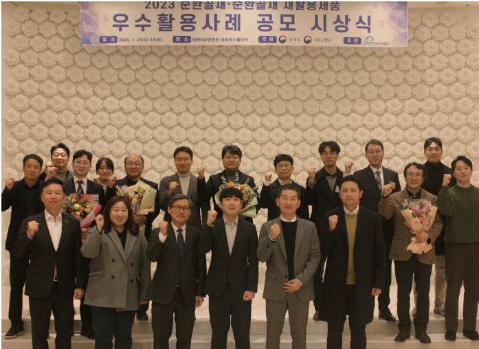
공모 시상식 및 발표회

한국건설자원협회는 순환골재와 순환골재 재활용제품에 대한 사용자 인식 제고 및 자원순환 체계 확립 등을 위해 범정부 차원의 '제15회 순환골재·순환골재 재활용제품 우수활용사례 공모전'을 개최합니다. 금번 공모전에 접수된 활용사례들은 정부와 학계, 산업계 전문가 등 건설폐기물 재활용 분야 전문가로 구성된 심사위원회의 심사를 거쳐 활용실적 등에 따라 시상내역이 선정됩니다. 아울러 오는 11월 개최 예정인 '우수활용사례 발표회 및 세미나'에서 우수활용기관에 대한 정부포상과 사례발표가 진행되며, 세부내용은 사례집으로 발간·배포할 계획입니다.